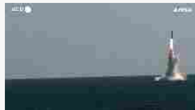
Corea del Sud, testato il missile da lancio sottomarino