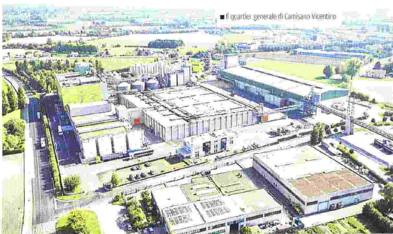
■ Il quartier generale di Camisano Vicentino